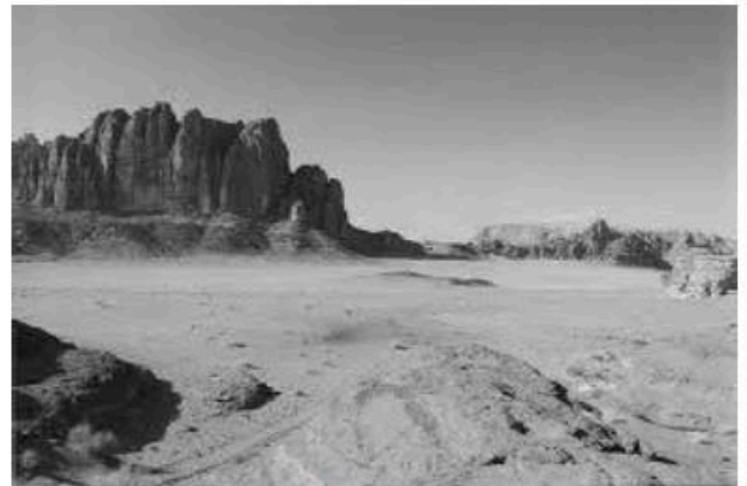
منظر لصحراء الجزائر

1-/- حدّد المكونات المحتملة لهذين المنظرين.