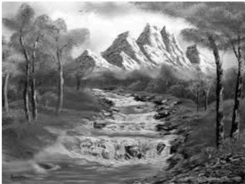
منظر لجبال الأطلس التلي

الوضعية الإدماجية: ( 08 نقاط ) طلب الأستاذ من التلاميذ جمع صور لتنوع المناظر الطبيعية في الجزائر فاختر أحد التلاميذ هاتين الصورتين: