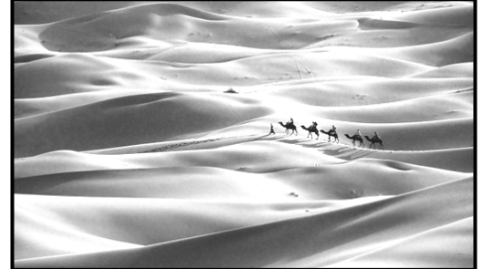
السند-2- تأثير الرياح