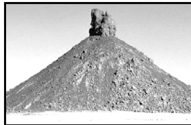
السند-5- بركان خامد من الهقار

التعليمة: بالاعتماد على معارفك و السندات :