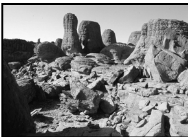
السند-4- منظر من الهقار