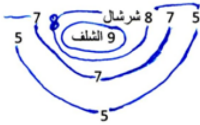
الوثيقة - 1