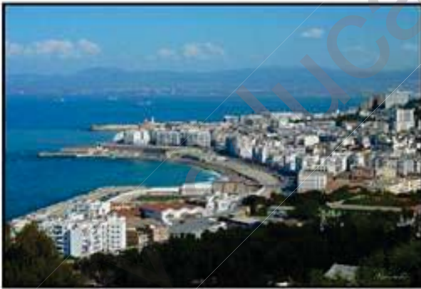
الوثيقة (2) : مدينة باب الواد

قصد التعرف على العوامل التي تؤدي الى تغير التضاريس و ما ينتج عنه من تطور في المنظر الطبيعي نقدم اليك الوثائق (1) (2) و(3):