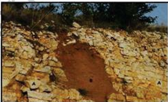
الوثيقة (3) : تربة كنسية يتخللها الفضل